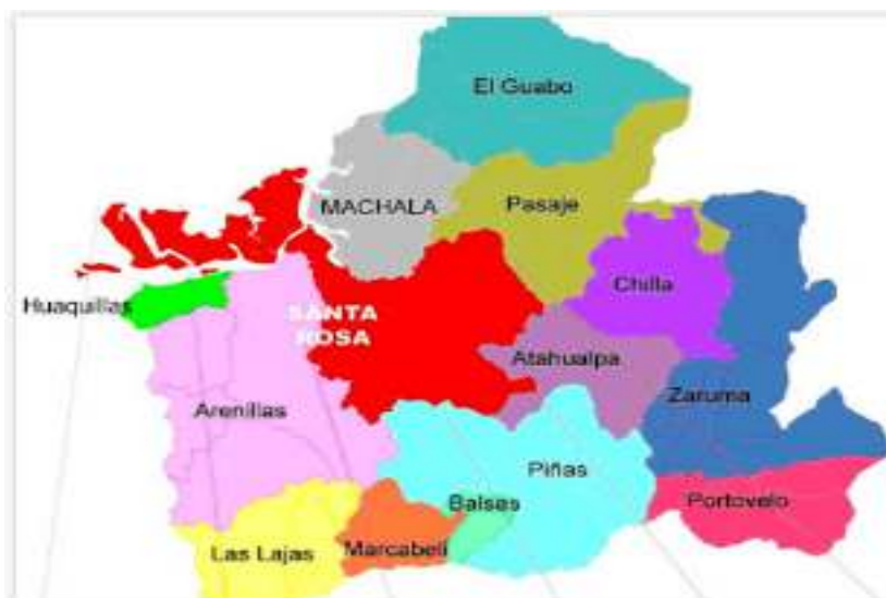
Gráfico 1.- Mapa de la Provincia de El Oro

La Provincia de El Oro es una de las 24 provincias que conforman la República del Ecuador, situada en el sur del país, en la zona geográfica conocida como región litoral o costa. Su capital administrativa es la ciudad de Machala, la cual además es su urbe más grande y poblada; ocupa un territorio de unos 5.988 km 2 , siendo la duodécima provincia del país por extensión. Sus límites son: al norte con Guayas, al sur y este con Loja, por el noreste con Azuay, y al occidente con el Departamento de Tumbes, Perú. En el territorio oreense habitan 715.751 personas proyectado al año 2020, según el último censo nacional (2010), siendo la sexta provincia más poblada del país. La Provincia de El Oro está constituida por 14 cantones, de las cuales se derivan sus respectivas parroquias urbanas y rurales.