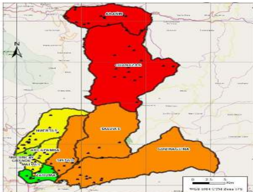
Gráfico 2.- Mapa del Cantón Zaruma

La población económicamente activa, proyectada al 2018 es de 11.537 personas; de ésta 5.449 (47,23%) están ubicados en el área urbana y 6.088 (52,77%) en el área rural. Las actividades de mayor relevancia que concentran el 60,15% de la PEA son: Explotación de minas y canteras el 31,13%, Agricultura, ganadería, silvicultura y pesca el 18,12% y Comercio al por mayor y menor el 10,90%. 1